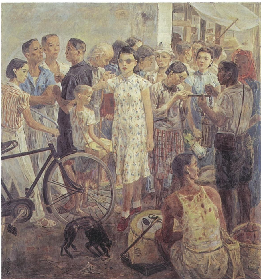
李石樵 市場口 1945 油彩畫布 157×146cm 李石樵美術館藏

李石樵總是以新的思想領導大家，雖然那個時期都是以寫實主義表現，但在主題、布局、筆法、色彩總合的面貌就成為「石樵先（尊稱）」的作品，李石樵意識到光復後的局勢不同日據時期，於是他從唯美的寫實主義，轉而反映社會現象的題材，以寫實風格來表現現實