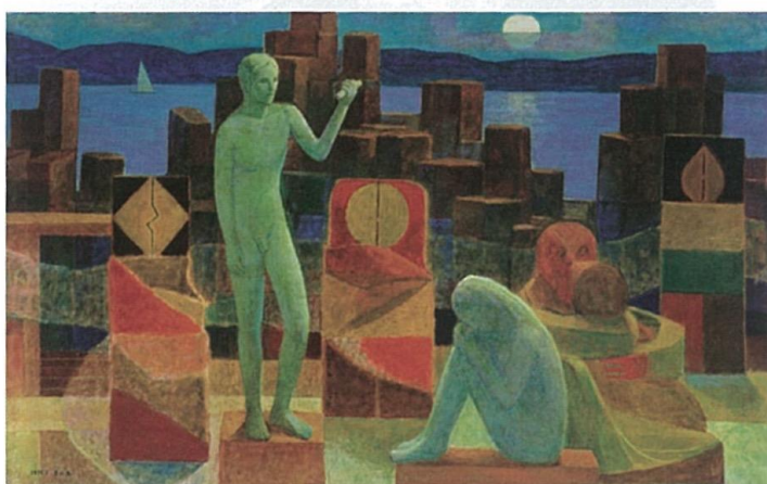
李石樵 永劫 1975 油彩畫布 182×259cm 李石樵美術館藏