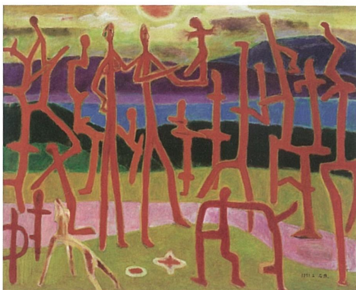
李石樵 團樂 1971 油彩畫布 120×162cm 李石樵美術館藏

1970至1990年代，李石樵開始由抽象回歸到寫實主義。1973年後不再創作任何抽象幾何作品，這階段創作多是〈三美圖〉和「裸女群象」系列，1980年代因移居美國探親，創作多以美國和台灣兩地的自然風景與休閒生活為主。此期風格建立的兩個根源是波那爾和塞尚。塞尚主張以球體、圓柱體、圓錐體處理複雜的大自然景物，把畫面還原簡單化的結構，李石樵運用此觀念在「裸女群象」系列，簡化裸女的描寫、著重表現畫面的構成，〈三美圖〉裸女不論是站、是坐、是臥，都呈現穩定的構圖，色彩反而顯現一種拙趣。晚年的寫實作品力求高彩度的燦爛絢麗，1985年後靜物呈現富麗堂皇的畫面效果，到1990年代就不見雕刻痕跡，油彩薄塗、筆觸粗獷，畫布顯露愈多，一派天真平淡。