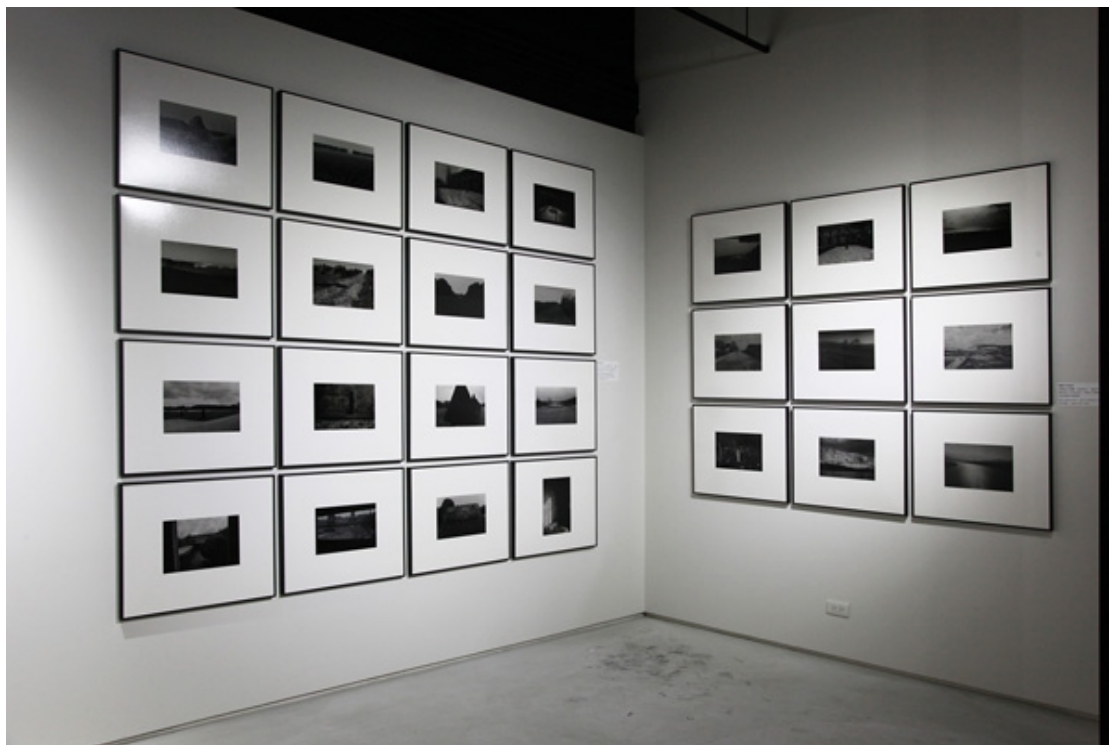
(圖:郭英聲 201 影像筆記個展 )