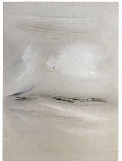
林壽宇 | 無題 (25.12.59) 油彩、畫布 127 x 91.7cm 1959

在 戰後抽象藝術發酵下，長年以來被低估的台灣極簡主義藝術家林壽宇終於受到關注，去年林壽宇《繪畫浮雕 12.12.63》一作在香港蘇富比春拍中以超過估價380萬至580萬港元，含佣金912萬港元成交，除了刷新藝術家拍賣紀錄外其身價更直逼千萬港元，是戰後抽象藝術中不可忽略的黑馬。